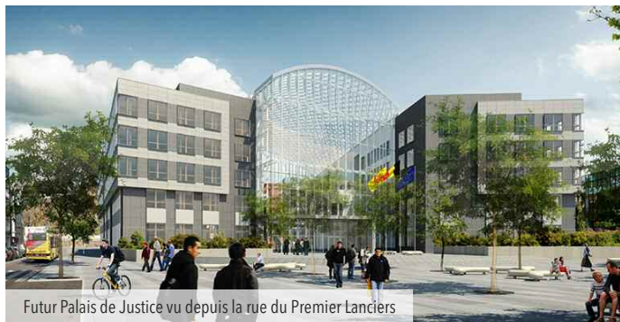
Futur Palais de Justice vu depuis la rue du Premier Lanciers

Le projet de futur Palais de Justice est un projet fédéral pour lequel un permis a été octroyé en 2012 et dont les travaux devraient commencer fin 2016.