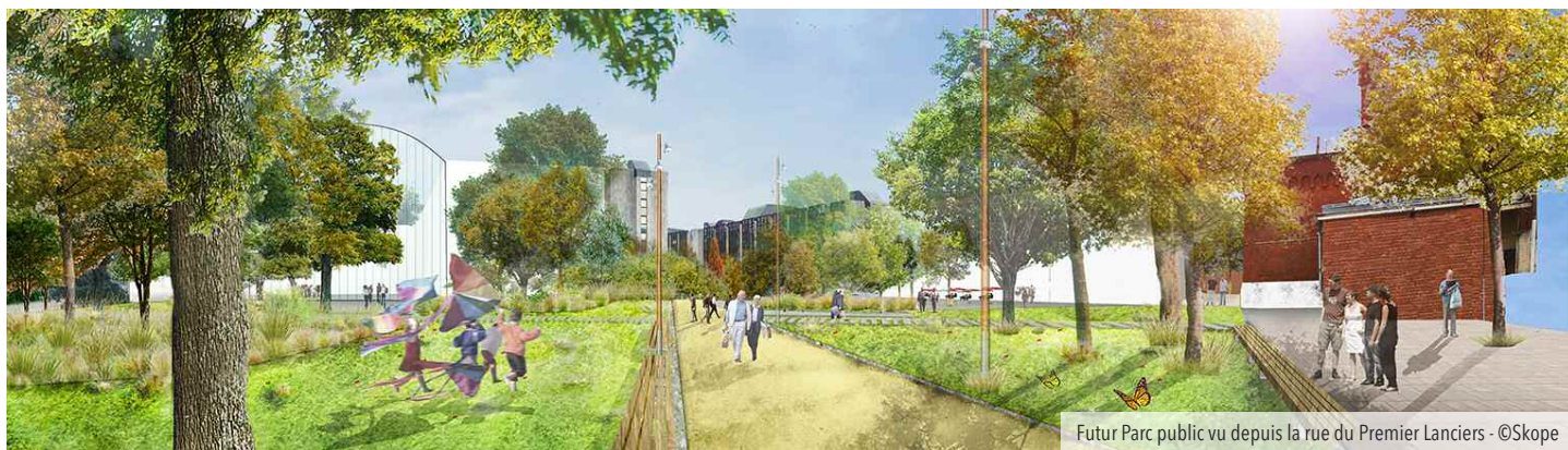
Futur Parc public vu depuis la rue du Premier Lanciers

Le second projet, mené par la Régie foncière de la Ville de Namur, consiste en la création d'un îlot de logements (avec commerces et services au rez), d'un parking souterrain, d'une nouvelle bibliothèque et d'un parc public de pleine terre.