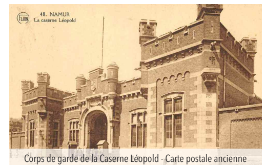
Corps de garde de la Caserne Léopold - Carte postale ancienne

Avec la démilitarisation du site, des projets urbanistiques voient le jour. En 1973, le terrain est scindé entre la Ville et la Régie des Bâtiments afin de permettre la construction d'une cité administrative. Les pavillons de la Caserne seront rasés dans les années '80 lors de l'édification des trois buildings de la cité administrative. Achevée en 1987, cette dernière reste le seul projet ayant abouti. En effet, l'ensemble des bâtiments envisagés ne seront jamais construits. Un plan communal (PCA) est réalisé dans les années '90 pour y implanter des bureaux, des logements et des commerces. Encore une fois, ce projet est abandonné. Il faut attendre 2009 pour qu'un nouveau plan d'urbanisation (PRU) soit élaboré dans le cadre de l'implantation sur le site du futur Palais de Justice.